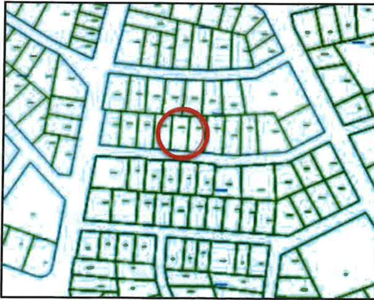
Şekil 2. Kadastral Durumu